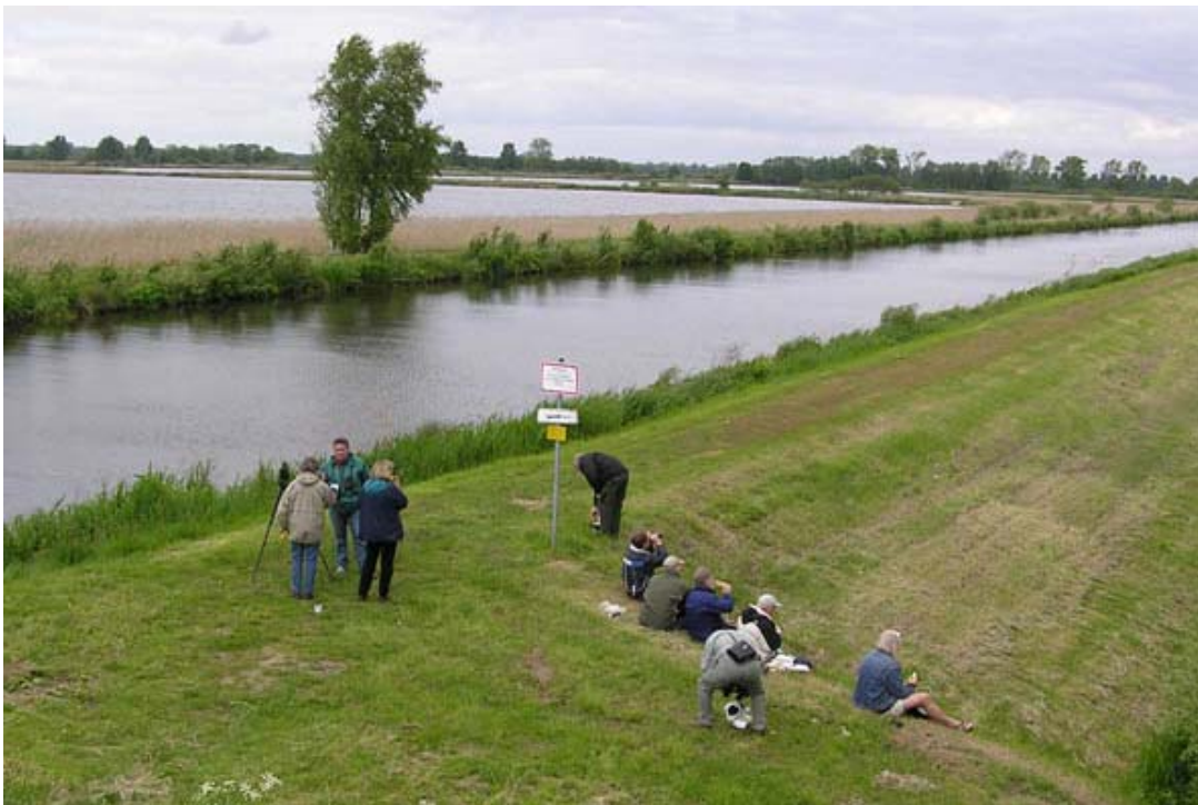
Madpakken nydes med udsigt over Lewitz området.

Efter yderligere et par Pungmejsler mm. gik turen videre til en sø, hvor han for nylig havde hørt Drosselrørsanger. Den var der stadigvæk, men havde nu fået selskab af yderligere 1-2 syngende hanner. Herfra kørte vi hen til et fugletårn midt i området. Selve tårnet er ikke så godt lavet, men man har alligevel et godt overblik over området, da terrænet er blevet hævet for at lave en bro på stedet. Desuden er området ret varieret, med søer/damme, sump, krat og enge. Det gav bla. endnu en Drosselrørsanger, Pungmejse, Fyrremejse + en del Klokkefrøer, som underholdt os med deres sjove ”tuden”.