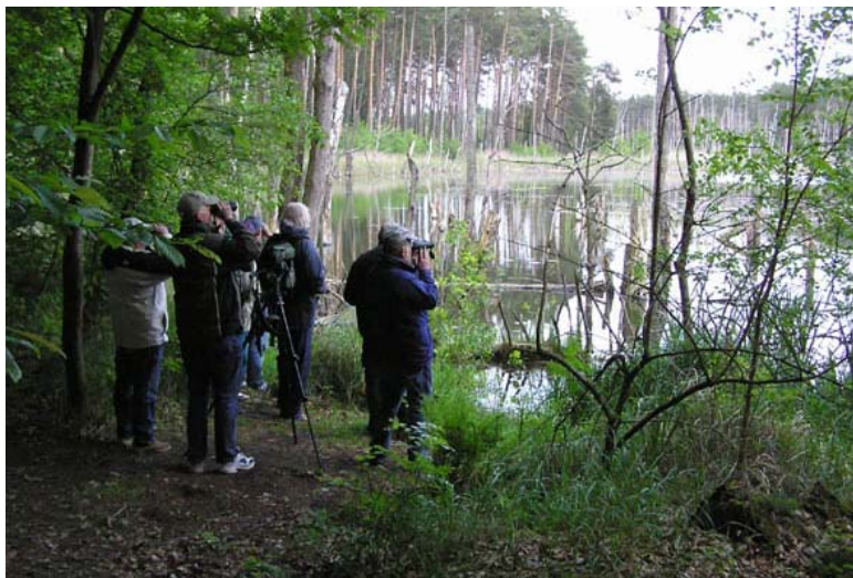
Turens deltagere kigger ud over Mühlensee.