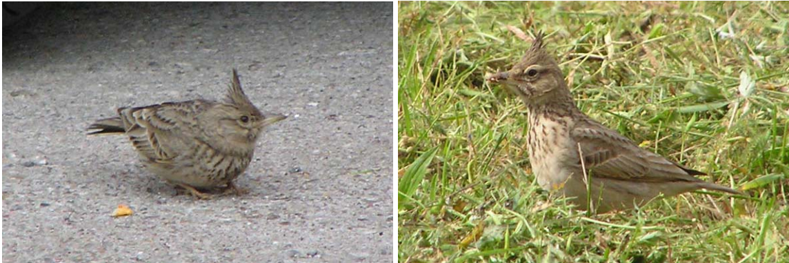
Toplærker i Parchin.

Vi brugte en halv times tid på de i alt 3 Toplærker, som var meget tillidsfulde, og vi kom ind på ganske få meter af dem.