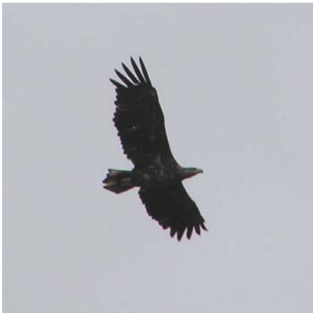
Havørn over Lewitz.

Undervejs så vi de første par Havørne, og da vi steg ud af bilerne på vores bestemmelsessted, blev vi næsten helt overvældet af alle de fugle der mødte os. I luften over dammene hang 3 Havørne og 1 Fiskeørn. På engene langs vejen gik der et par Traner, og luften over søerne var mættet med Mursejlere og svaler.