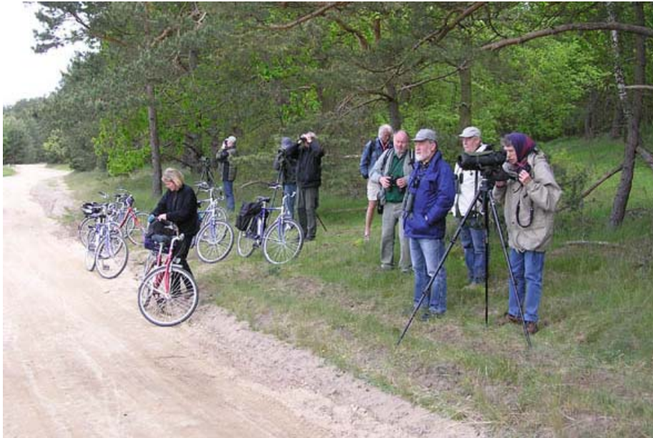
Der kigges på fugle i Boeker Mühle Fischteiche

Vi fik cyklerne, og fik pakket alt vores grej på dem, hvorefter vi sad op og kørte ud i nationalparken. Første stop var ved fiskedammene (Boeker Mühle Fischteiche), hvor der var masser af fugle! Vi kørte et par kilometer langs med nordsiden af dammene, og gjorde holdt hver gang der var nogenlunde udsyn over dem. Det gav bla. Fiskeørn, Rød Glente, Sort Glente, Havørn 3, Lærkefalk, Knarand 38, Rødhovedet And 32, Drosselrørsanger og Pungmejse.