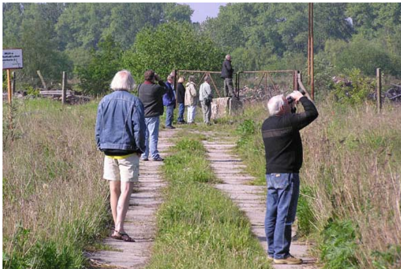
Deltagerne på Karmindompapjagt i Rechlin Nord.

Da nøglerne var blevet afleveret satte vi kursen mod Danmark. Vi lavede dog et sidste stop ved Rechlin Nord, og denne gang lykkedes det! Karmindompappen sad meget fint og sang i de små træer i det åbne område, og alle fik den set rigtigt godt. Derudover så vi også Rød Glente, Fiskeørn, Bynkefugl 4 og Græshoppesanger 2, samt en flot Grønspætte, som fløj lavt hen over området.