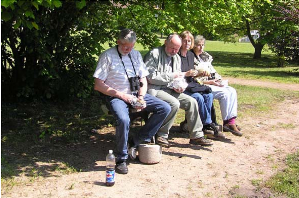
Nogle af turdeltagerne nyder deres madpakker i parken i Neustadt Glewe.

Herfra kørte vi til Neustadt Glewe, hvor vi ville holde vores middagspause. Turen dertil gav bla. Hvid Stork og 2 Røde Glenter.