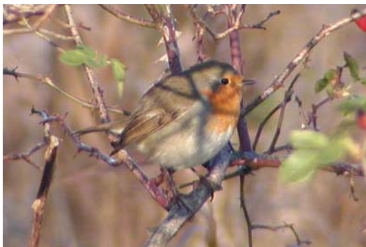
Foto 14 Rødhals i Hyben nedenfor Banzelwitzer Berge

En lille morgentur rundt i området omkring pladsen gav bl.a. en flok på 35 Rådyr. I Teetzizer See lige nord for Banzelwitz lå der ca. 7.000 Troidænder, 1.000 ubestemte dykænder og 2.000 ubestemte svømmeænder. Over rørskovene omkring søen så og hørte vi 7 Skægmejser, der fløj rundt med sin typiske, metalliske "pling-pling". Desværre lykkedes det os ikke at få billeder af dem. Vi måtte "nøjes med" en lille, smuk Rødhals (foto 14 [- 203s]).